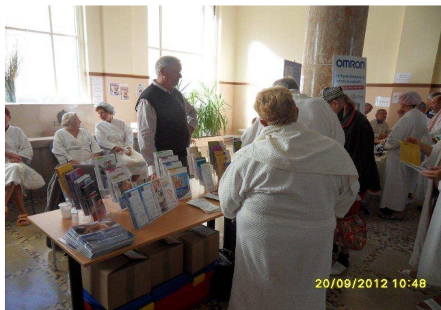
Atelier à Bains les Bains